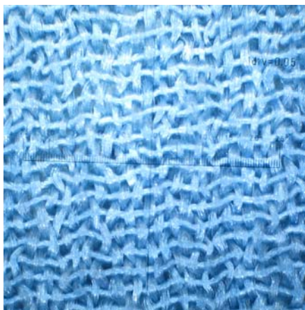
図1 浅葱縮緬地瀧に鼓模様小袖（拡大図）

上記2点の復元模作に用いる生地（縮緬・綸子）の制作を、京丹后市丹後ちりめん織元田勇機業株式会社および京都府織物・機械金属振興センターに依頼。生地制作にあたり、オリジナルの作品調査のため、来年度に生地制作者が作品を実見し、より組成と風合いの近いものを目指す。