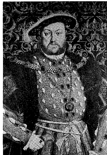
図3 『ヘンリーVIII世』ハンス・エウォルト, 1539年, チャッツワース・コレクション(部分)

先にも触れたようにスペインでは, 1530年代初期, それまで流行していた深い衿ぐりが少しずつ小さくなり, 首にぴったりした立ち衿が見られるようになる 図1。そして, ブーシェが述べているように, 1539年ハンス・エウォルト作の『ヘンリーVIII世』図3, それと1538年ティツィアーノ作の『フランソワI世』の肖像画図4を見てもわかるように, 1530年代末期にはこの立ち衿がイギリス, フランスでも広まっていた 7) 。