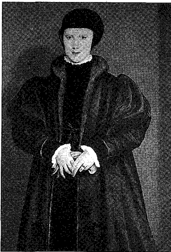
図2 『ミラン公爵夫人クリスティーナ』ホルバイン, 1538年, ロンドン ナショナル・ギャラリー蔵(部分)