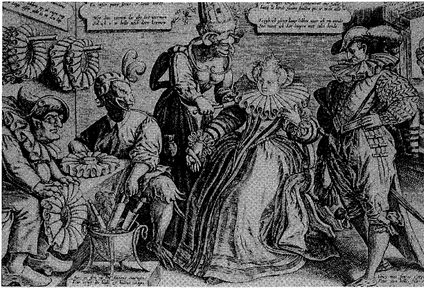
図9 『ruffの製造工程を描いた風刺画』, 1595年頃

襷が作り出される。このことによって、かなり大きな ruff の襷も作り出すことが出来た 39) 。9 図はこれらの道具を使って、ruff を作る様子を描いた風刺画である。左下の火鉢の中にポッキング・スティックが入っている。そして、中央の人物が取り出したそれを ruff に押し込んで型をつけている。また、後ろの壁には出来上がった ruff の形をいかに崩さないように掛けている様子を見ることが出来る。面白いのは、糊付けをしている人物が人間ではなく、Ph. スタップスの言っている‘悪魔’として描かれていることである。