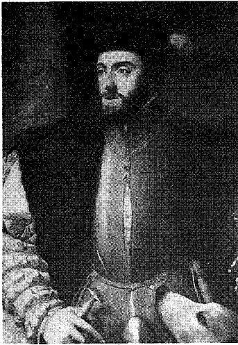
図1 『カルルV世』ティツィアーノ, 1533年, プラド美術館蔵(部分)