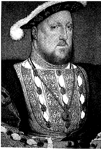
図5 『ヘンリーⅧ』ホルバイン, 1537年, ルガーノ, ティッセン・ボルネミッサ・コレクション蔵