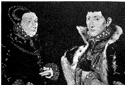
図7 『フランシス・ブランドンとエイドリアン・ストーク』ハンス・エウォルト, 1559年, 個人蔵