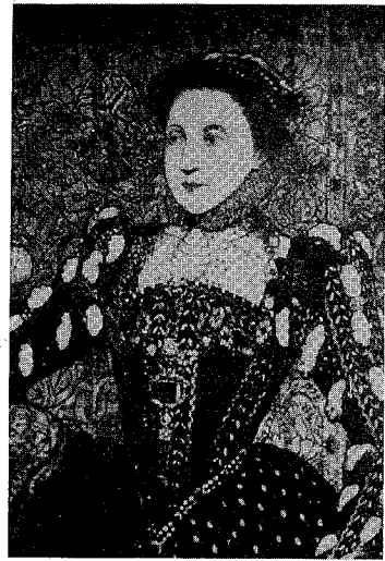
図8 『エリザベスⅠ世』作者未詳, 1560—65年, ハムデン邸 (部分)