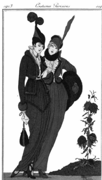
1913年 散策用のドレス A. ヴァレ画