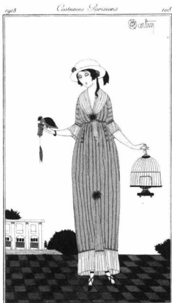
1913年 縞柄のリンネルのドレス C. マルタン画