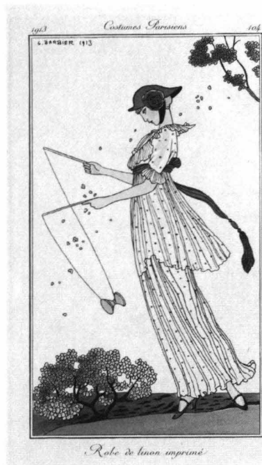
1913年 プリントのリンネルのドレス G. バルビエ画