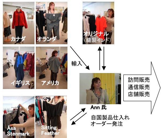
Fig. 3 Clothing shop of Klädvalet Sverige company Klädvalet Sverige 社の衣服販売

身体障害者の協会 (DHR) のインタビューでは、寝たきりの高齢者は基本的におらず、特別に工夫された衣服はそれほど必要ないが、容易な着脱、やわらかい素材、ゆとりが必要とのことであった。また、身障