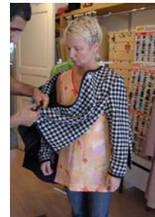
Fig. 2 Jacket ジャケット