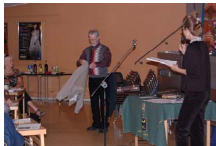
Fig. 1 Fashion show ファッションショー