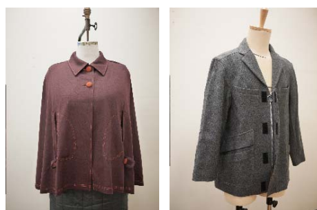
Fig. 5 Examples of clothes made in 2009 平成 21 年度製作衣服例

事前学習において示した福祉にかかわる衣服情報においては、特にスウェーデンの福祉事情や作品に対して興味を示す学生が多く見られた。衣服製作においては、12 名の履修者がグループに分かれ 7 名の対象者の衣服を製作した。製作した作品はニット製品を中心にジャケット 3 着、パーカー、ケープ、トレーナー、パンツ各 1 着であった。図 5 に製作した衣服（ケープとジャケット）を示した。対象者からは履修者の対応状況、製作衣服について、大変よい評価を得た。履修者のアンケート結果を見ると、本授業に対してある程度満足していると答えた履修者が多かった。しかし、本研究授業の対象者は社会復帰の目的で職業訓練中であり、障害の程度も比較的軽かったため、既製衣服に対しての不満も少なかったと考えられ、クリエイション活動にもの足りなさを感じた履修者もいた。自由回答結果より、身体障害者に対するクリエイション活動に必要なことは何か、という質問に、「必要な機能を活かしたデザイン」「着脱のしやすさ」など機能性面をあげるとともに、「対象者とのコミュニケーション」「障害に対する知識・理解」など、対象者を理解しコミュニケーションをとることの必要性についての回答もみられた。さらに、「障害者だとはわからない衣服を作る工夫」など、ユニバーサル